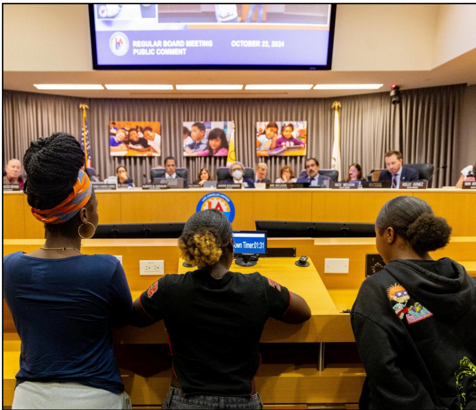
South Central Youth Empowered Thru Action (SCYEA) youth leaders make public comment at the Los Angeles Unified School District Board meeting about the importance of BSAP and the programming's impact on them.

The Black Student Achievement Plan (BSAP) was supposed to be for Black students who were struggling with academics. Not only has it been used for academics, but also for mental health resources such as emotional awareness and management. BSAP is needed for multiple reasons. One of the main reasons is being a safe space for those who feel they have no one to turn to.