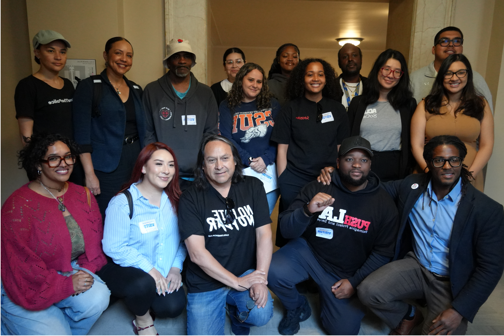
MEMBERS OF THE PUSH LA COALITION AND SOUTH CENTRAL LOS ANGELES RESIDENTS

“The main takeaway is that public policy around the nation is shifting to prevent racially biased stops and end harmful police practices that undermine community safety,” Smith said. “The data speaks for itself. Pretextual stops impact thousands of Black and Brown Angelenos each year, creating generational trauma and eroding trust in our safety systems.”