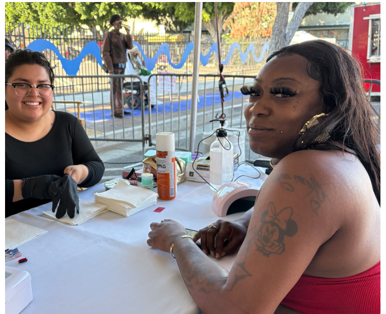
La asistente del Festival MLK toma el CoCo Dream Poll mientras disfruta de una manicura.

Al llevar la barbería al corazón del Festival MLK, Community Coalition reafirmó su compromiso de poner las voces de la comunidad en el centro de la atención y de crear espacios donde el diálogo conduzca a la acción, dando continuidad así al legado de cuidado colectivo y cambio impulsado por la gente que defendió el Dr. King.