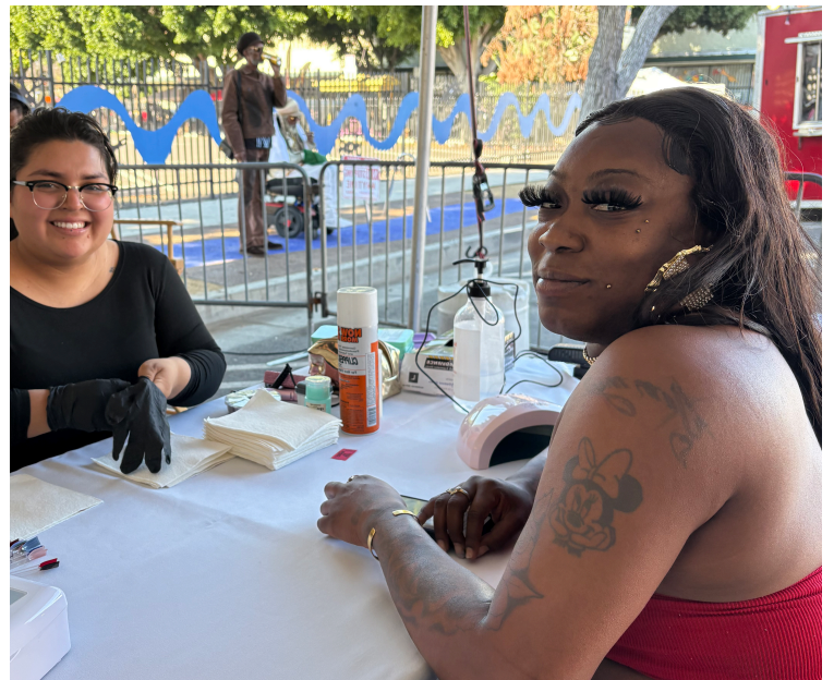
MLK Festival goer takes CoCo Dream Poll while enjoying a manicure.

By bringing the barbershop to the heart of the MLK Festival, Community Coalition reaffirmed its commitment to centering community voices and creating spaces where dialogue leads to action — continuing the legacy of collective care and people-powered change that Dr. King championed.